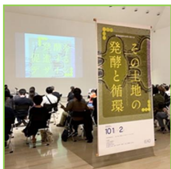
2022年10月文化創造館にて開催された「その土地の発酵と循環」のグラフィックを担当させていただきました。